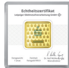
Sicherheitskapsel und Echtheitszertifikat mit der Unterschrift des Münzdirektors.